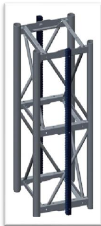
Mástil 450 x 450 x 1505