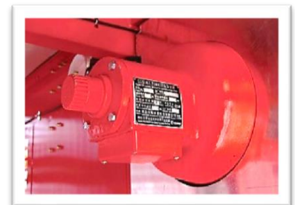
Freno de seguridad