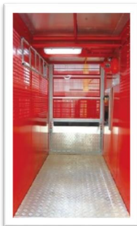
Interior de cabina